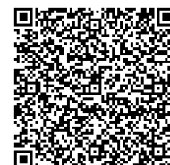
Carte de visites

Taguez ces codes QR sur votre smartphone